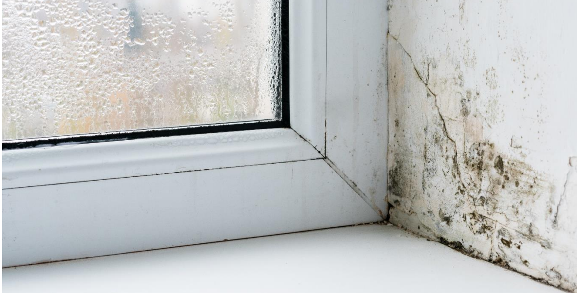
Schimmelbefall in der Wohnung