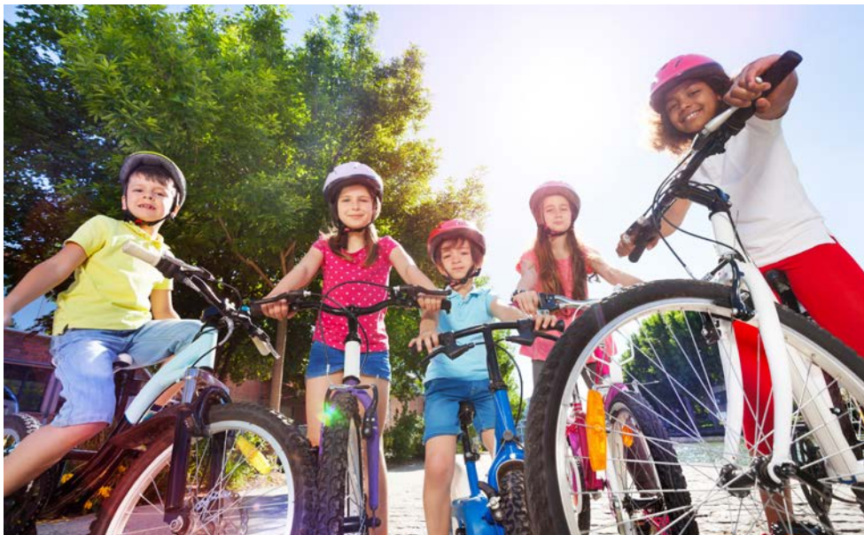
Kinder sind bei Radfahrkursen begeistert dabei.

Die motorischen Fähigkeiten der Kinder werden geschult und der Kurs dient als Vorbereitung auf die Bewegung im Verkehrsraum. Durch den klimaaktiv mobil Radfahrkurs sollen die Kinder das Fahrrad als bewegungsaktives und klimaschonendes Verkehrsmittel wahrnehmen und im Alltag einsetzen. Alle Informationen zu den Radfahrkursen finden Sie hier: klimaaktivmobil.at/radfahrkurse