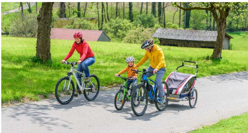
Mit Fahrrad-Kinderanhänger flexibel unterwegs.

In Zügen der WESTbahn sind jedoch Kinderwagen mit Fahrradanhängerfunktion von der Beförderung ausgeschlossen.